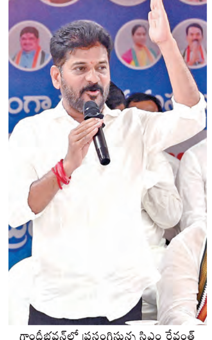
గాంధీభవన్లో ప్రసంగిస్తున్న సిఎం రేవంత్

సెలవు పండుగ సందర్భంగా గురువారం 'వార్త' కార్యాలయానికి సెలవు. శుక్రవారం సంచిత వెలువడదు. పునర్ముద్రణం 2వ తేదీ శనివారం