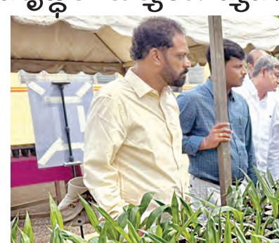
గెలలకు అధిక విలువను సృష్టించడానికి కావాల్సిన చర్యలు వివరాలతో తనకు సహాయం చేస్తామని మలేసియా అధికారులను ఆహ్వానించారు. పామాయిల్ గెలలకు అధిక విలువను సృష్టించడానికి కావాల్సిన చర్యలు వివరాలతో తనకు సహాయం చేస్తామని మలేసియా అధికారులను ఆహ్వానించారు.

హైదరాబాద్, అక్టోబరు 30. ప్రభాతవార్త: రాష్ట్రంలో వ్యవసాయ రంగానికి అత్యధిక ప్రాధాన్యతతో పాటు, రైతుల సంక్షేమం, అభివృద్ధి కోసం కోట్ల రూపాయల వ్యయంతో వివిధ పథకాలను అమలు చేస్తోందిని వ్యవసాయ మంత్రి తుమ్మల నాగేశ్వరరావు చెప్పారు. ఈ నేపథ్యంలోనే రాష్ట్రంలో పామాయిల్ సాగు విస్తరణకు ప్రభుత్వం కృషి చేస్తోందన్నారు. ఇందులో భాగంగా పామాయిల్ ఉత్పత్తిలో స్వయం సమృద్ధి సాధించేందుకు మలేసియా తరహా విధానాలను అవలంబించనున్నట్లు బుధవారం ఒక ప్రకటనలో వెల్లడించారు. దీనికి సంబంధించి ఇటీవల