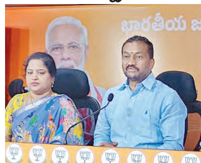
హైదరాబాద్, అక్టోబరు 30 ప్రభాతవార్త: గ్రామపంచాయతీ లను రాష్ట్ర ప్రభుత్వం నిర్వహించే సందర్భంగా ఎంపి రఘునందన్ రావు మండి పడ్డారు. బుధవారం పార్టీ కార్యాలయంలో ఏర్పాటు చేసిన మీడియా సమావేశంలో మాట్లాడుతూ, కేంద్ర ప్రభుత్వం మహాత్మాగాంధీ గ్రామీణ ఉపాధి హామీ పథకం కింద రూ.1200కోట్ల విడుదల చేస్తే, రాష్ట్ర ప్రభుత్వం కేవలం రూ.200కోట్లు మాత్రమే ఖర్చు చేస్తుందన్నారు. మిగిలిన రూ.1000కోట్ల నిధులను రేవంత్ రెడ్డి

సర్కారు ఇతర కార్యకలాపాలకు దారి మళ్లించిందని ఆరోపించారు. గ్రామపంచాయతీల్లో విద్యుత్ బిల్లులు చెల్లించలేని పరిస్థితి ఉందన్నారు. పల్లె ప్రగతి నిధులు వెచ్చించడం లేదని దూరబట్టారు. పంచాయతీ కార్యదర్శులు సొంతంగా కాన్సాటిక్ చార్జీలను రూ.200కు పెంచారు. 5 లక్షల వరకు ఖర్చు చేస్తున్నారన్నారు.