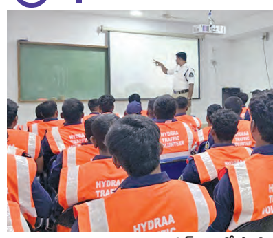
ట్రాఫిక్ విషయాలపై హైద్రా వలంటీర్లకు శిక్షణ

హైదరాబాద్, అక్టోబరు 30. ప్రభాతవార్త: జంబు నగరాలు, శివార్లలో ట్రాఫిక్ గతబిజినీ చర్యద్దెందుకు జక ముందు ట్రాఫిక్ పోలీసులకు తోడుగా హైద్రా వాలంటీర్లు సహాయం అందించనున్నారు. గ్రేటర్ పరిధిలోని కీలక జంక్షన్లలో