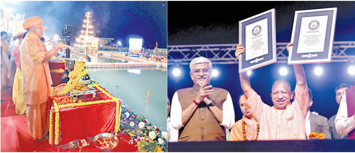
బుద్ధవారం ఆమోద్యలో దీపం వెలిగించి కార్యక్రమాన్ని ప్రారంభిస్తున్న యుపి సీఎం | 28 లక్షల దీపాల గిన్నెస్ రికార్డు పత్రాలను చూపుతున్న యోగి