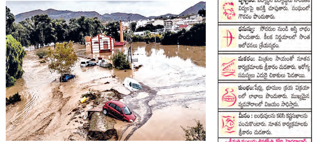
స్కూల్ లోని అలోరా, మలగ పల్లెల్లో భారీ వరదలకు కొట్టుకుపోయిన కార్లు